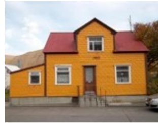
Heimilið að Grundagötu, Siglufirði.