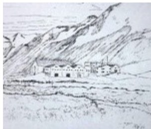
Íþróttamiðstöðin að Hóli Siglufirði. Úr dagblöðum á