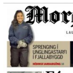
Hluti forsíðu Morgunblaðsins í dag.