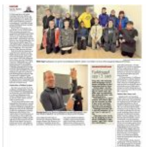
Og greinin sjálf.