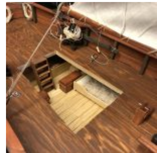
Hér er búið að taka aftara dekkhúsið af svo að sést í stiga, kojur og matarkistur.