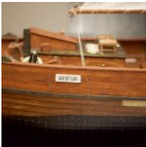
Gestur er fyrsta þilskip Ólafsfirðinga.

Vindböndin sjást hér greinilega en þau voru notuð þegar rifa þurfti seglin. Auk þess má líta nokkur áhöld sem brúkuð voru þegar hákarl náðist.