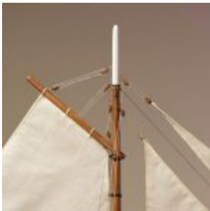
Þetta er gríðarlega vönduð smíð.

hann þrýstir ekki á til að loka þeim heldur er með þær opnar, grípur utan um hlutinn, sleppir takinu og þær lokast.