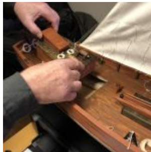
Aftara dekkhúsið fjarlægt.