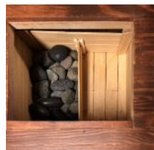
Meira að segja grjótið í ballestina var sótt inn í Ólafsfjörð.