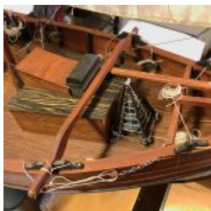
Allt er unnið ofan í minnstu smáatriði.

Árið 1872 er Gestur horfinn úr Ólafsfirði og sennilega ónýtur.