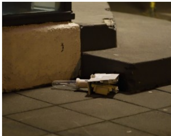
Perustæði úr nærliggjandi ljósastaur við Aðalgötu.

Um hádegisbilið á að hafa dregið mikið úr vindi, að því er lesa má á vef Veðurstofu Íslands.