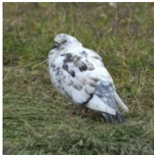
En svo eru þær líka skræpóttar.