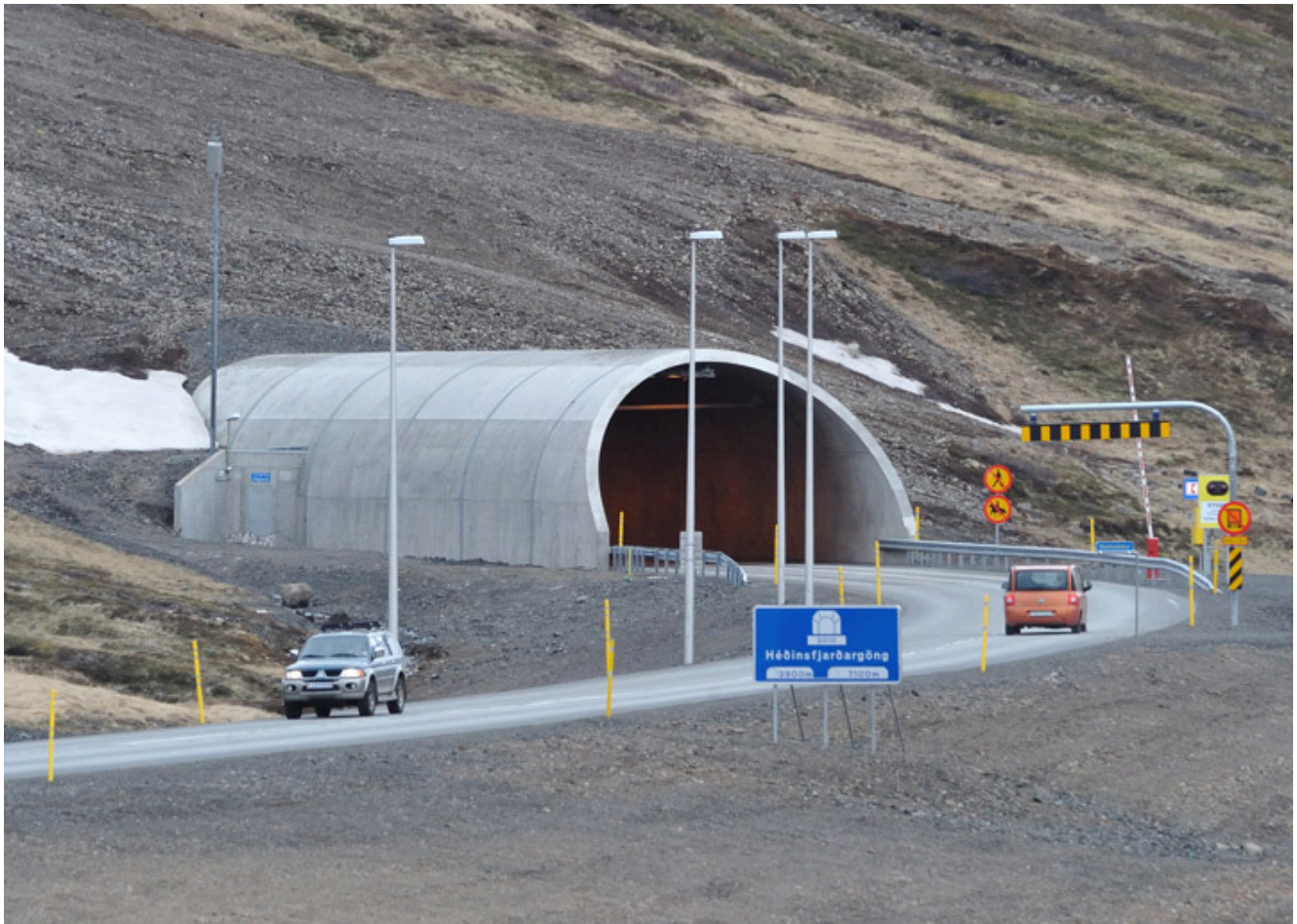
Margir bílar fóru um göngin í dag.

Enn fellur umferðarmetið um Héðinsfjarðargöng, ef frá er talinn vígsludagurinn, áður en teljarinn var settur upp, því þegar 10 mínútur voru eftir af þessum degi höfðu 1008 bílar farið þar um. Á sama tíma höfðu 996 bílar farið um Öxnadalsheiði og 399 um Siglufjarðarveg. Vera má að veðrið setji strik í reikninginn hvað morgundaginn varðar, en það kemur í ljós síðar.